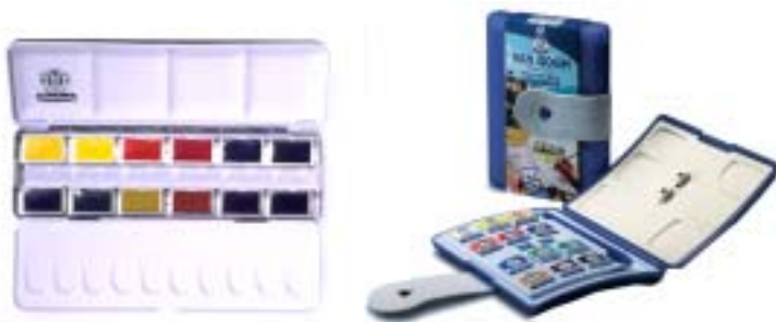
Schmincke Akademie lajitelma ja Talens Van Gogh taskurasia

SIVELTIMET: Sivellin on paperin lisäksi tärkein työskentelyvälineesi. Ilman hyvää (ja valitettavasti kallista) sivellintä voi jopa tulla tulokseen ettei osaa maalata vesiväreillä. Sivellintä valitessasi pätee vain yksi sääntö: ostetaan paras mahdollinen!